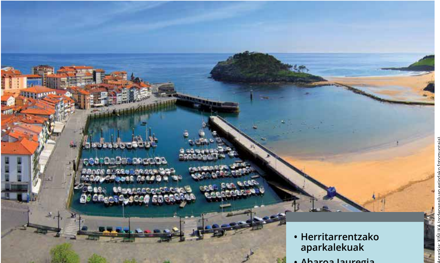
(ordenagailuan egindako fotomuntaia).